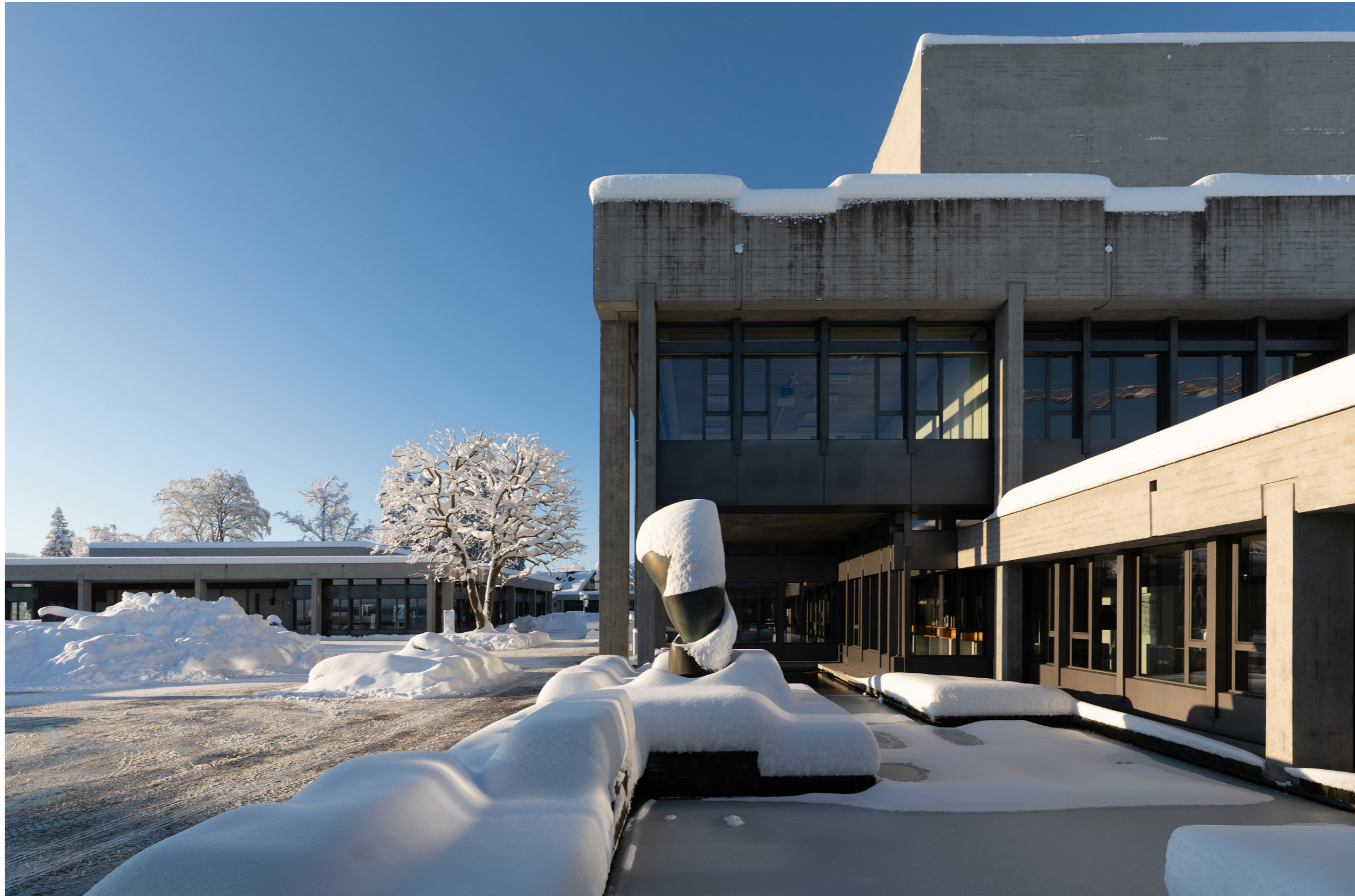
Hauptgebäude der HSG

Member of the academic board of the New Europe College Bucharest