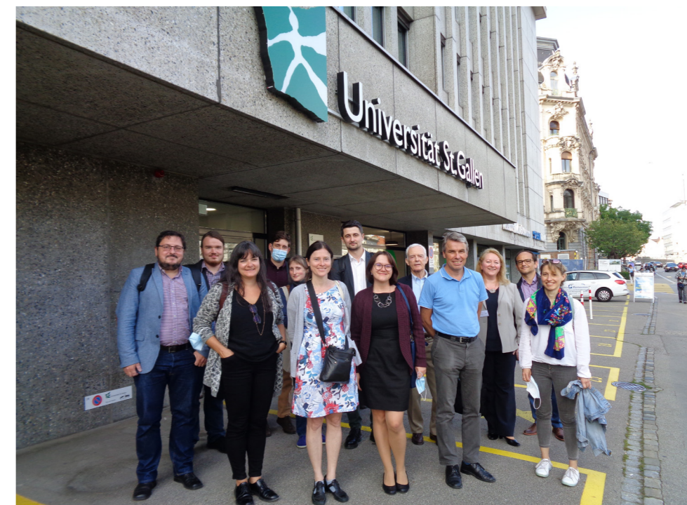
The annual conference “Transculturality in the Black Sea Region: New Theoretical Approaches and Research Methodologies”

Despite the unusual circumstances and the experimental hybrid format, the conference turned into a virtual and physical space for fruitful discussions and academic exchange. The video-recordings of all conference panels and book presentations are publicly available on the YouTube channel of the GCE.