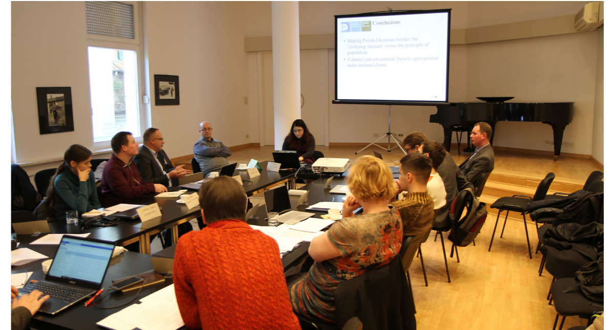
Workshop at the NEC "Making the borders of contemporary Ukraine"