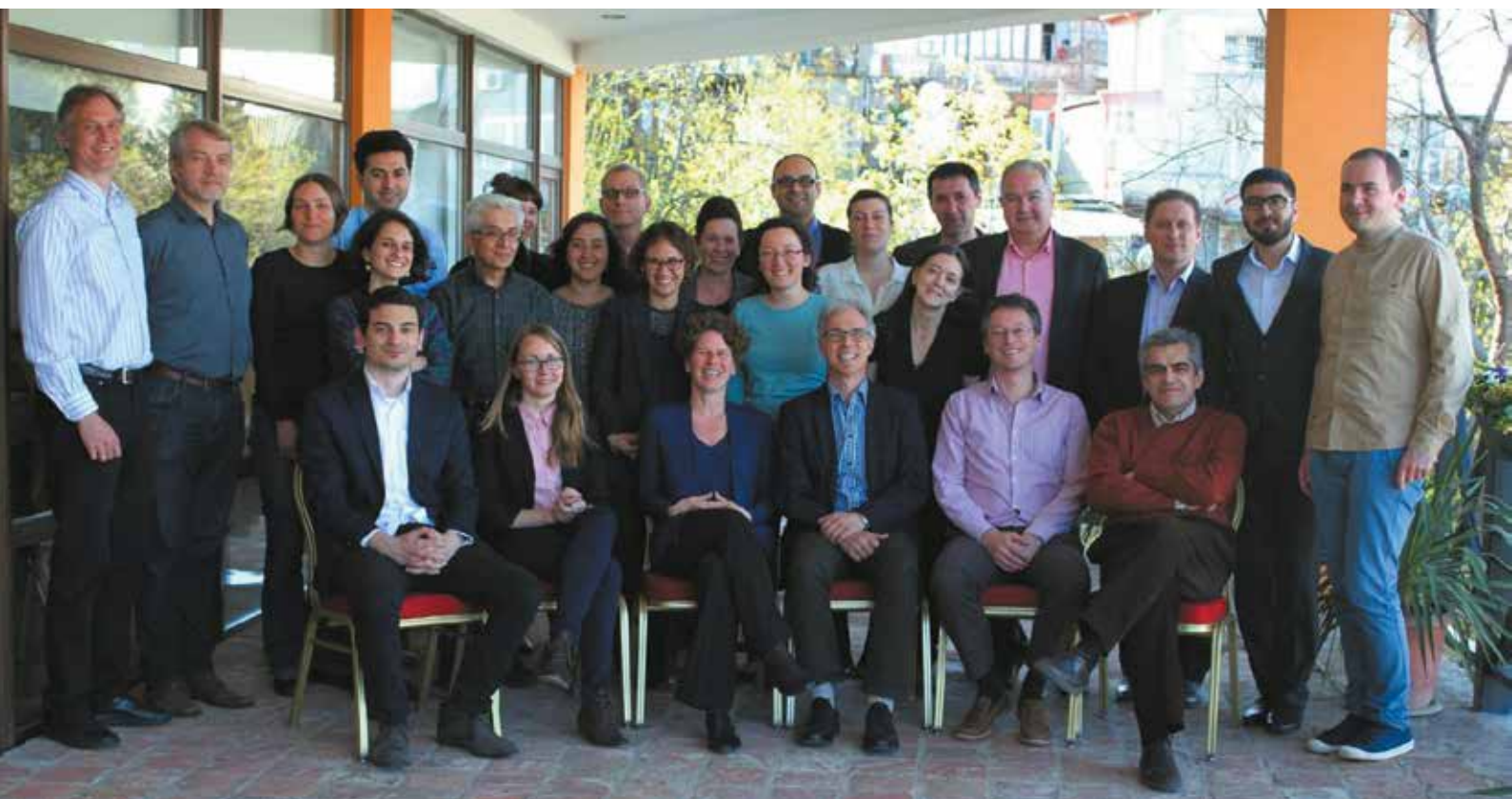
ISSICEU Research Members

EU-STRAT ist ein Konsortium mit elf-Partnerorganisationen, darunter sechs Universitäten, drei Think-Tanks, eine zivilgesellschaftliche Organisation und ein Beratungsunternehmen aus Deutschland, Moldau, Ukraine, Vereinigtes Königreich, Niederland, Polen, Frankreich, Litauen, Weissrussland, und der Schweiz.