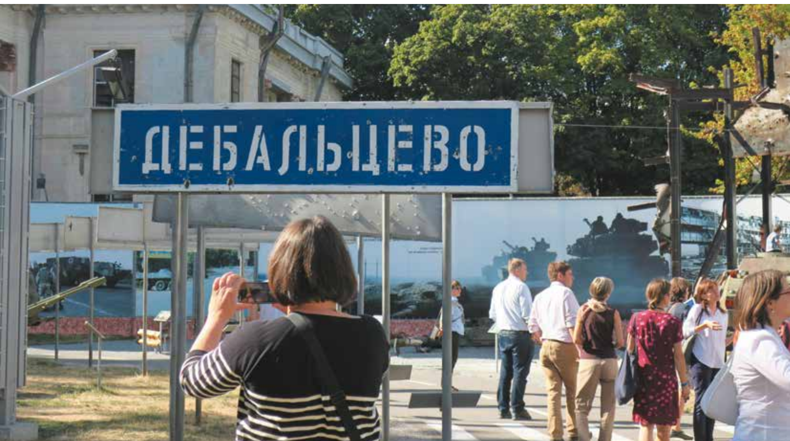
Exhibition „Ways of Donbass“, Dnipro, Ukraine, September 2016