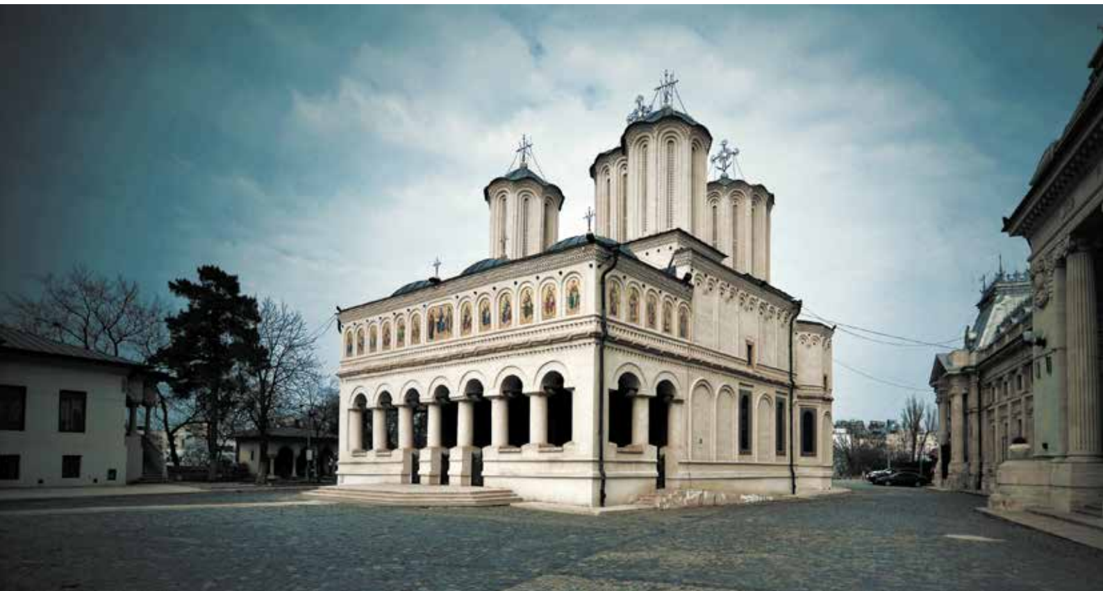
Patriarchal Cathedral, Bucharest, Romania