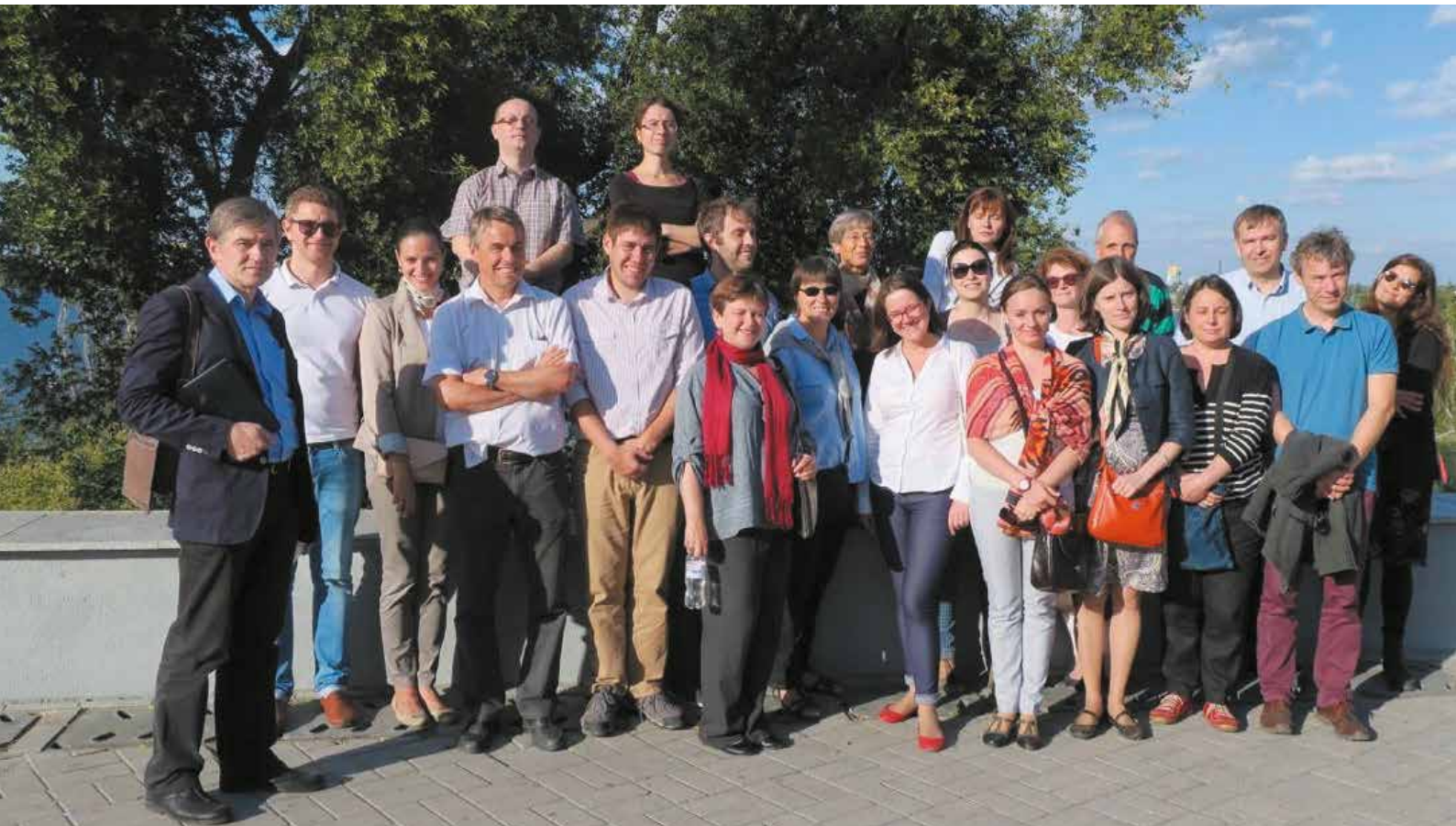
Participants of the Annual Ukrainian Project Conference in Dnipro, Ukraine, September 2016

fünfmonatige Stipendien an Wissenschaftler aus der Ukraine und Usbekistan. Auch in diesem Jahr wurden zwei Projekte finanziell unterstützt; „How to Teach Europe in the 21st Century?“ (unterstützt von der Robert Bosch Stiftung und der Stiftung Porticus) und „Does Monastic Economy Matter? Religious Patterns of Economic Behaviour“ (unterstützt vom GCE). Hinzu kam ein neues Stipendium für Künstler, welches von der Landis und Gyr Foundation unterstützt wird.