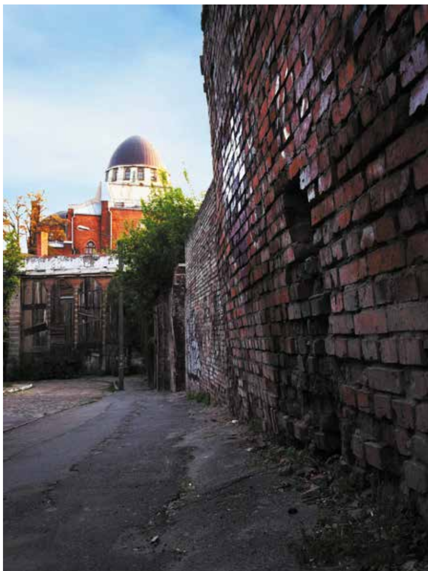
Choral Synagogue, Kharkiv, Ukraine