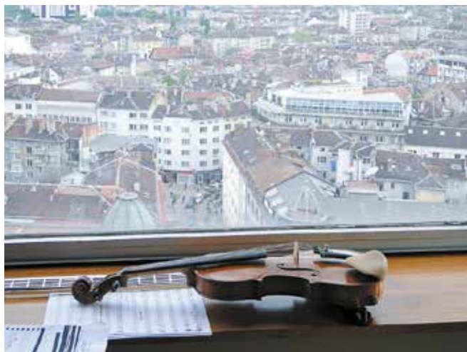
View from the CAS, Sofia, Bulgaria

Mitglied des Academic Board des New Europe College, Bukarest, Rumänien