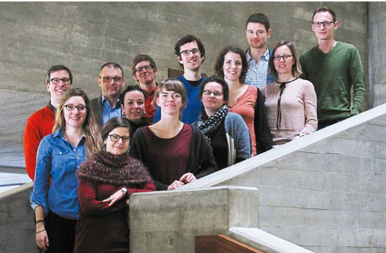
GOVPET Research Members

Das vom SBFi finanzierte Forschungsprojekt „Governance in Vocational and Professional Education and Training“ (GOVPET) wurde im Sommer 2015 ins Leben gerufen. Der Forschungsschwerpunkt liegt auf der Steuerung von beruflicher Grund- und Weiterbildung in den Staaten Dänemark, Deutschland, den Niederlanden, Österreich und der Schweiz. Gemeinsam bearbeiten Forscherinnen und Forscher der Universitäten St.Gallen, Lausanne und Köln sowie des Eidgenössischen Hochschulinstituts für Berufsbildung in Zollikofen insbesondere zwei miteinander verknüpfte Bereiche: Im ersten Bereich wird der Frage nachgegangen, wie freiwillige dezentrale Kooperation in der Berufsbildung hergestellt und aufrechterhalten werden kann und was die verschiedenen Anspruchsgruppen tun können, um diese Kooperation zwischen den verschiedenen privaten und öffentlichen Akteuren zu fördern. Im zweiten Bereich wird am Beispiel der Einbindung von benachteiligten Personen in das Berufs- und Weiterbildungssystem untersucht, wie private Akteure