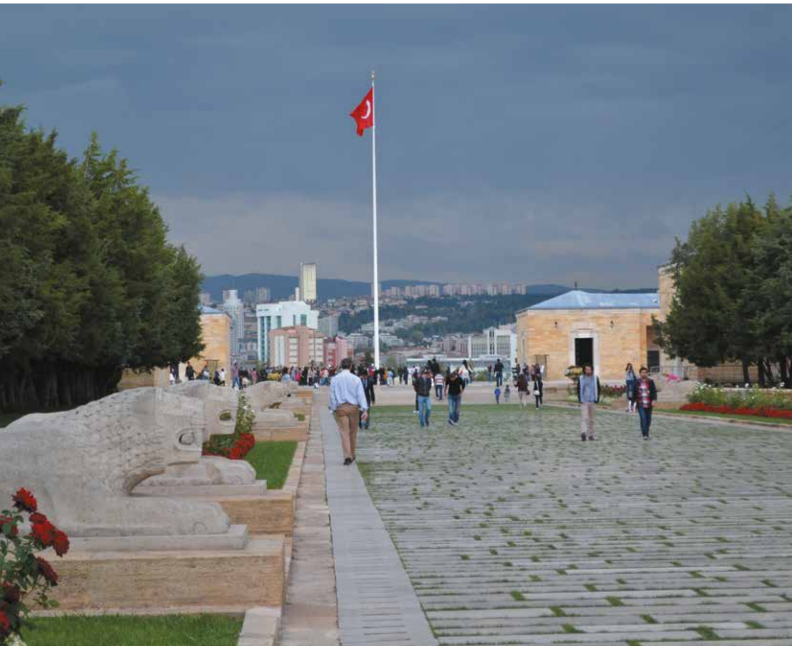
Atatürk Mausoleum (Anitkabir), Ankara, Turkey