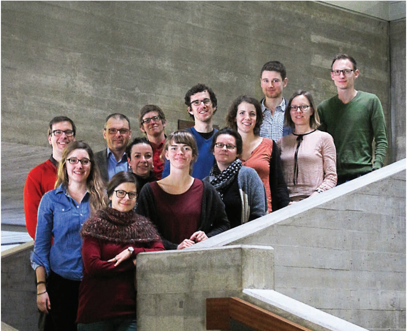
Team GOVPET, University of St. Gallen