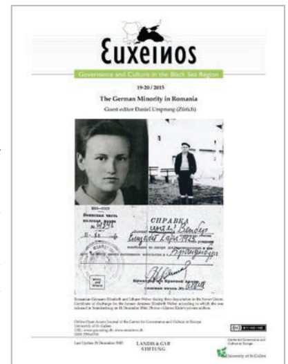
Euxeinos 19-20/ 2015. Cover

The GCE is also solely responsible for the online journal Euxeinos, which is published four times a year. The issues as well as individual articles are openly accessible and can be downloaded from the website of the GCE. Currently there are approximately 370 subscribers known by name. It is funded by the Landis & Gyr Foundation on a temporary basis. The online journal dealing with interdisciplinary topics related to the Black Sea region promotes networking activities between academics in Switzerland and various other regions. All articles are published in English and are therefore accessible to a broader range of readers. Euxeinos is one of the few publications which deal with the greater Black Sea region from multiple, interdisciplinary perspectives. Dr. habil. Carmen Scheide is editor-in-chief and Dr. Maria Tagangaeva head editor and layout artist.