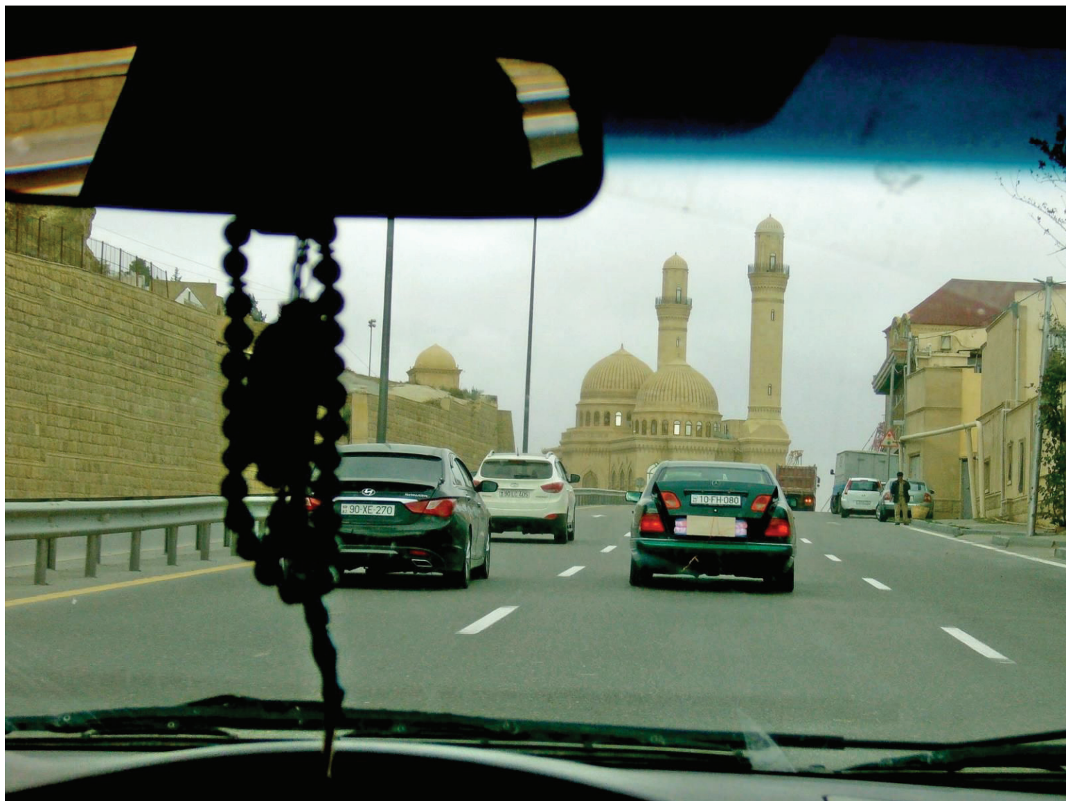
The Bibi-Heybat Mosque in Baku, Azerbaijan

The permeability of the Turkey-Caucasus border has significantly increased social and economic interactions. Diaspora groups play a significant role in the inter-societal interactions between Turkey and the Caucasus region. Some groups are mainly active in their homelands in the Caucasus, while others advocate cultural rights and are politically active in Turkey.