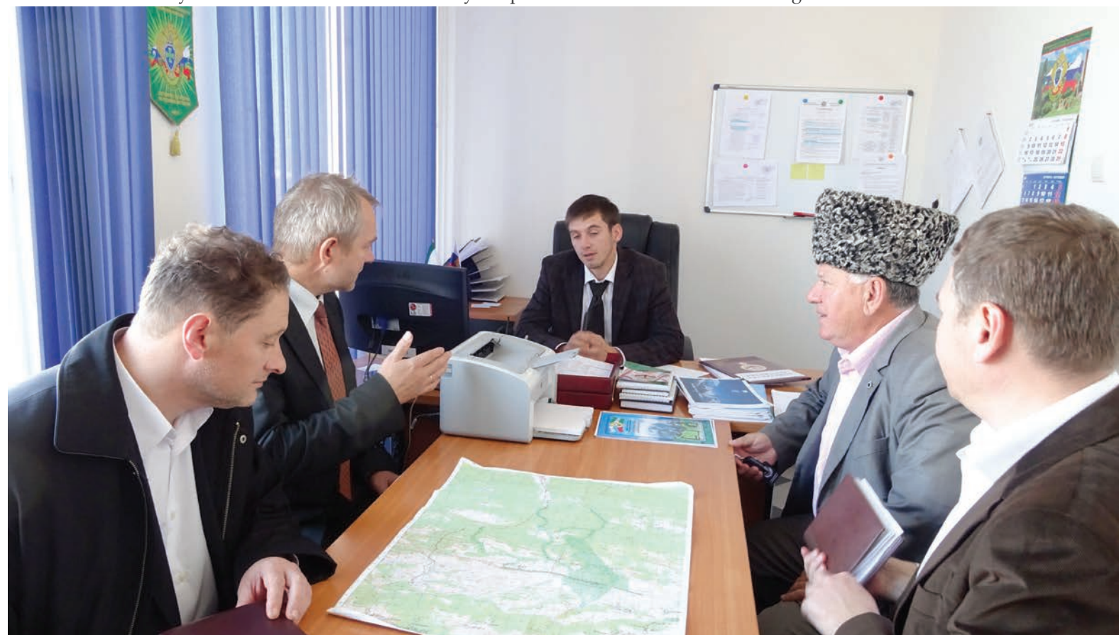
Meeting at the Ministry of Tourism, Ingushetia, North Caucasus

With regard to civil society ISSICEU deals with concepts of and forms of civic participation in the Caucasus. Representative quantitative surveys conducted from February to June 2015 in the North and South Caucasus served as key research instruments. The surveys inquired about the link between religious values as well as the