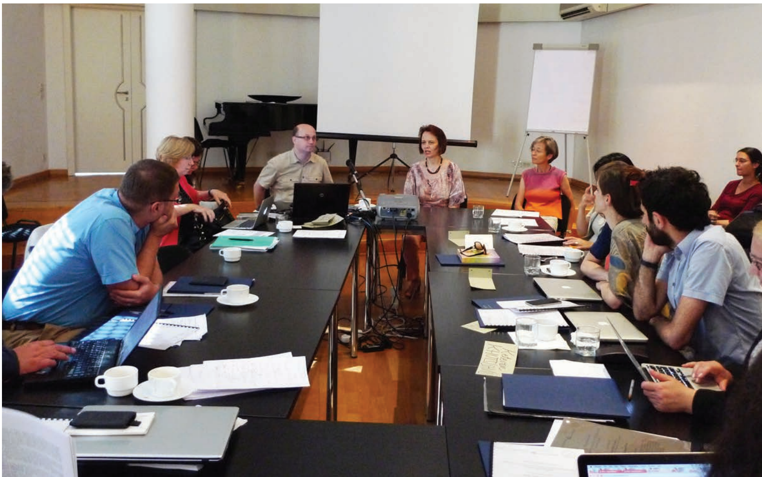
Workshop NEC, Bucharest, June 2015