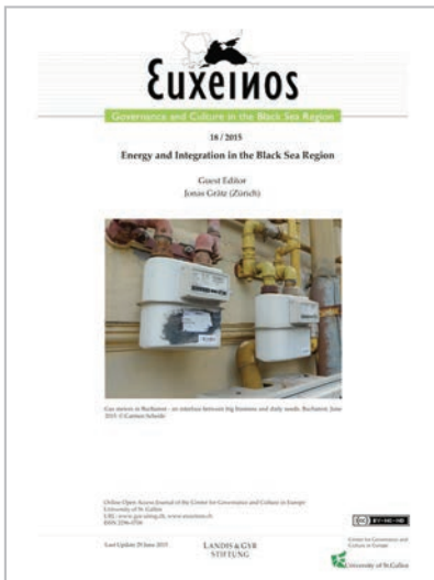
Euxeinos 18/ 2015. Cover.

Das GCE gibt eigenverantwortlich das online journal Euxeinos 4-mal pro Jahr heraus. Die Ausgaben oder auch einzelne Artikel können im open access von der website des GCE herunter geladen werden. Derzeit gibt es etwa 370 namentlich bekannte Abonnenten. Die Finanzierung erfolgt vorläufig über die Stiftung Landis & Gyr. Das online journal mit interdisziplinären Themen rund um das Schwarzmeergebiet dient zur Vernetzung mit Wissenschaftlern und Wissenschaftlerinnen in der Schweiz und den verschiedenen Regionen, zumal alle Artikel auf Englisch erscheinen und dadurch einem breiten Adressatenkreis zugänglich sind. Euxeinos ist eine der wenigen Publikationen, die sich mit der Grossregion Schwarzmeer multiperspektivisch und interdisziplinär beschäftigen. Chefredakteurin ist Dr. habil. Carmen Scheide; Dr. Maria Tagangaeva ist leitende Redakteurin und Layouterin.