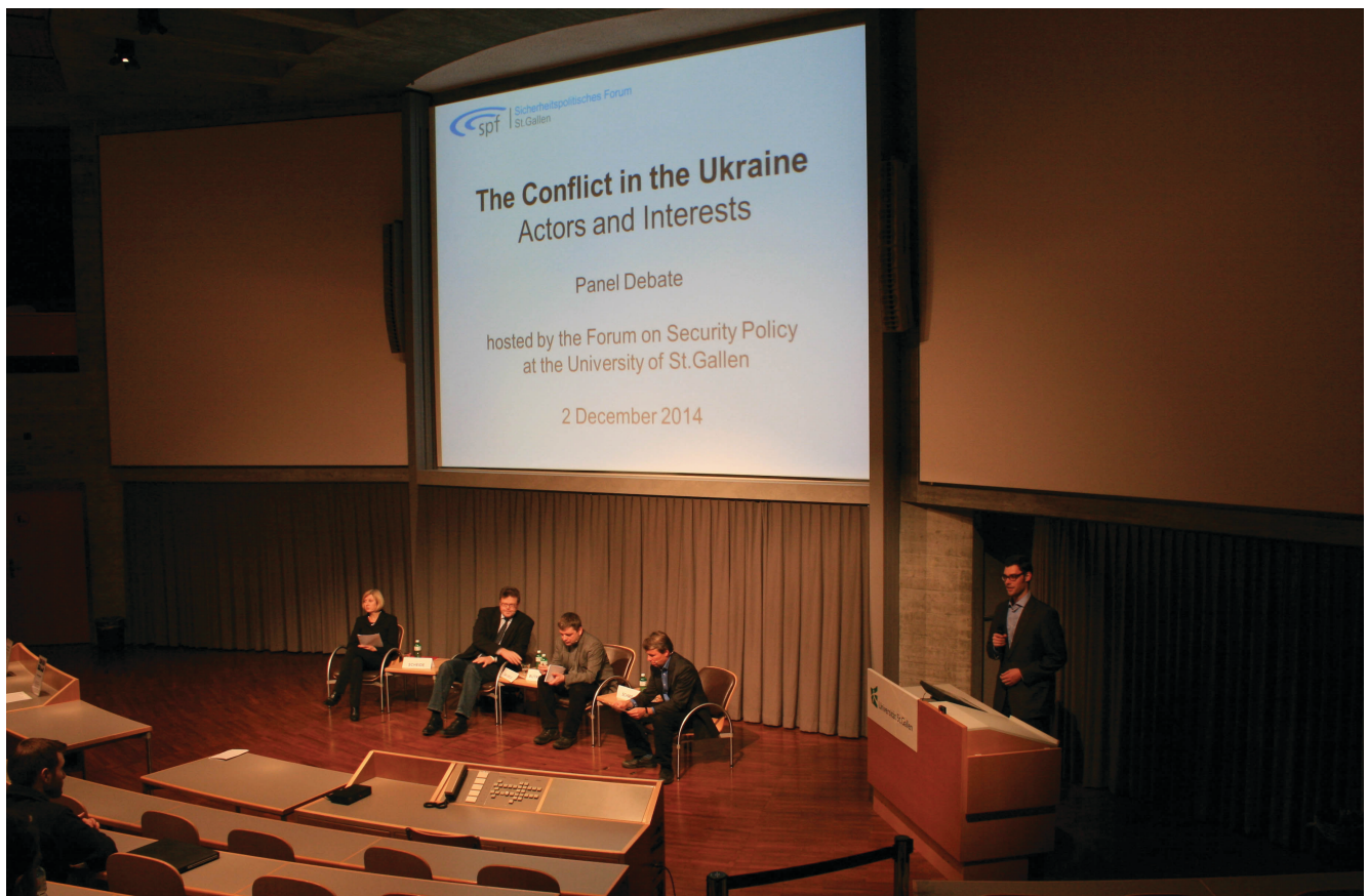
The Conflict in the Ukraine – Actors and Interests. Panel discussion, University of St.Gallen, December 2014