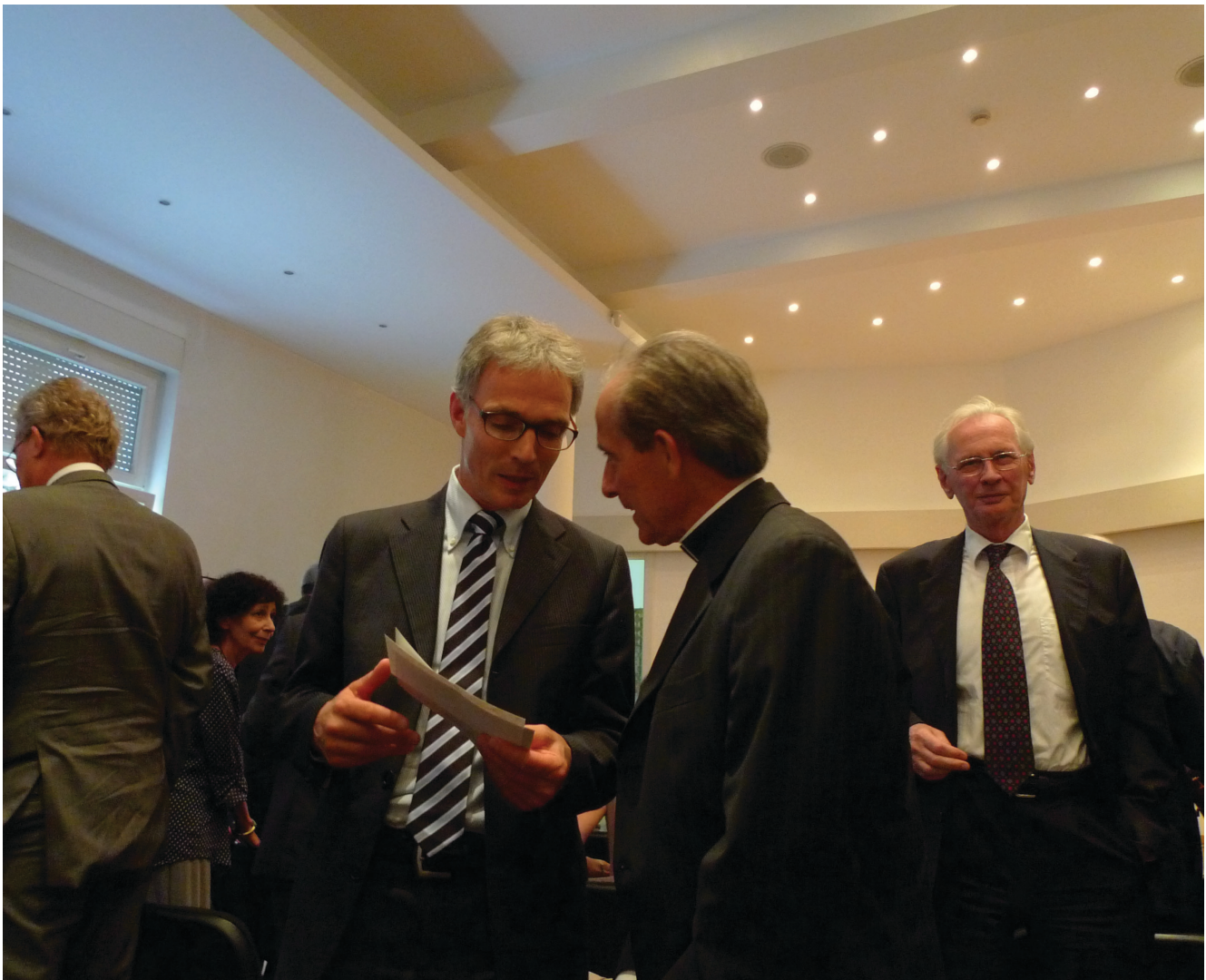
20-years anniversary of the NEC, Bucharest, June 2014

Eine Vernetzung des GCE auf nationaler und internationaler Ebene mit Forschungseinrichtungen und –netzwerken findet durch persönliche Kontakte, Konferenzbesuche, eigene Veranstaltungen und das online journal Euxeinos statt. GCE-Mitarbeiter und Mitarbeiterinnen nehmen an Treffen von Osteuropa-Experten, an Fachkonferenzen und Verbandssitzungen teil. (s. Chronik)