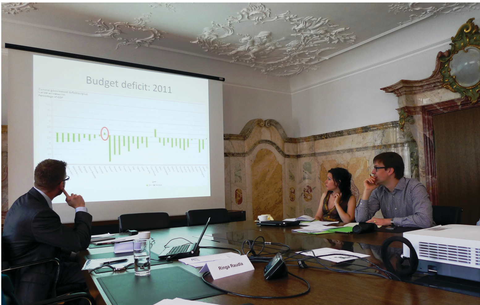
Conference „The Eastern Enlargement of the EU: Effects – Challenges – Visions“, St.Gallen, June 2014