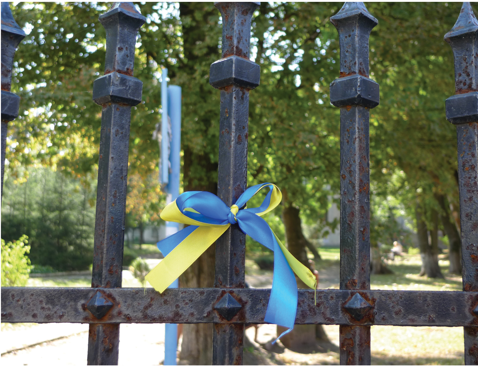
Chernivtsi, Ukraine, September 2014