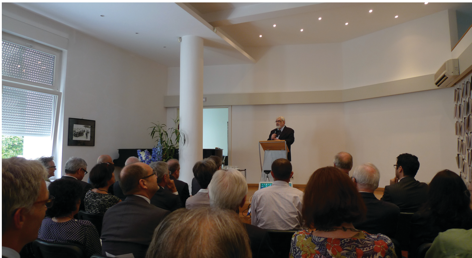
Founder of the NEC Andrei Pleșu, Bucharest, June 2014