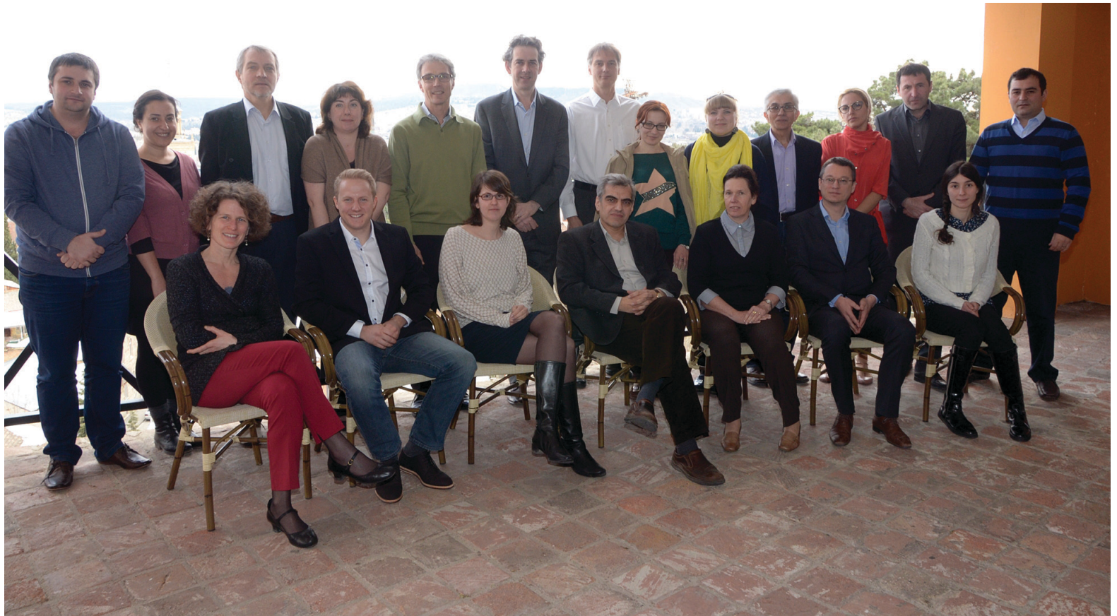
Kick-off event of ISSICEU, Tbilisi, 2014