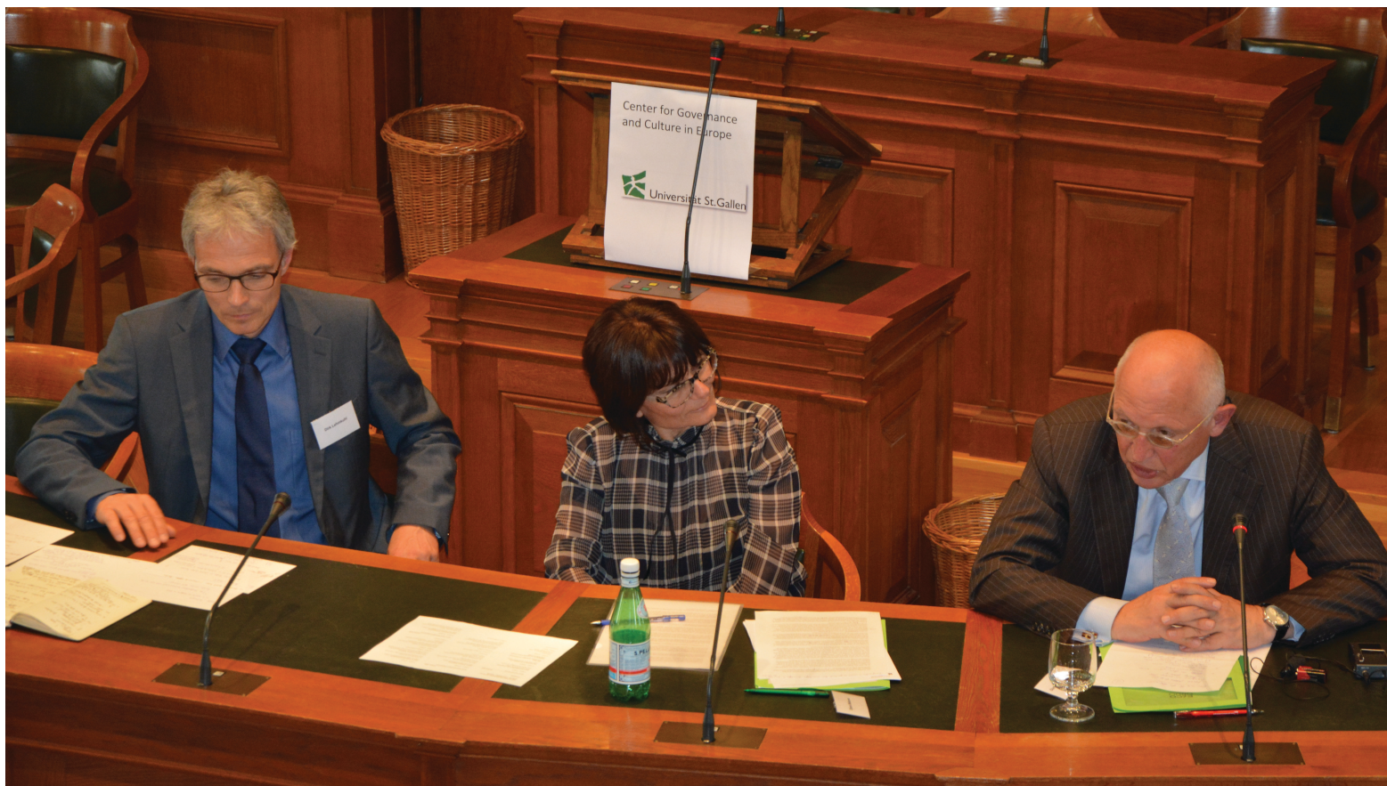
Conference „The Eastern Enlargement of the EU: Effects – Challenges – Visions“, St.Gallen, June 2014